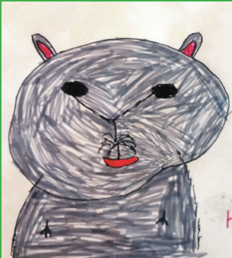
chomik - hamster

W tym numerze prezentujemy przedstawienia zwierzków, które wykonali uczniowie szkoły Mentis oraz ich nazwy po angielsku.