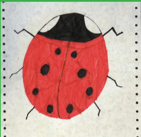
biedronka - ladybug/ladybird