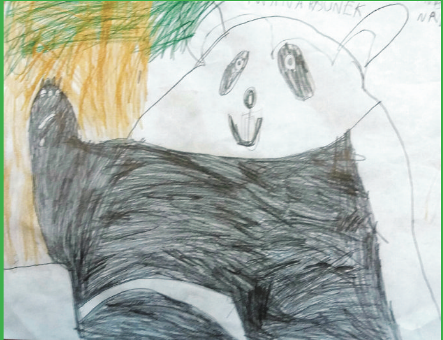
panda - panda