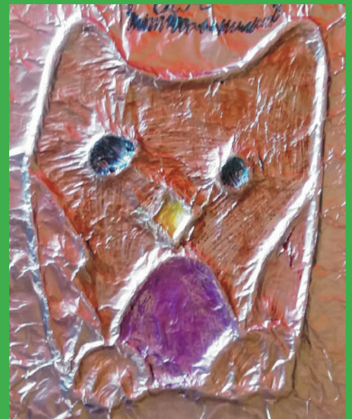
sowa - owl